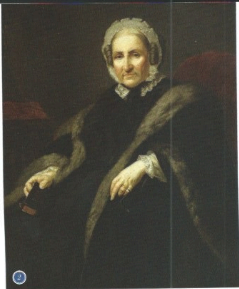
Portret Róży Sobańskiej – Józef Simmler, ca 1868, Muzeum Jana III w Wilanowie – fot. /2/

Portrait of Róża Sobańska – Józef Simmler, ca 1868, Museum of the King Jan III in Wilanów, fot./photo: Zbigniew Reszke