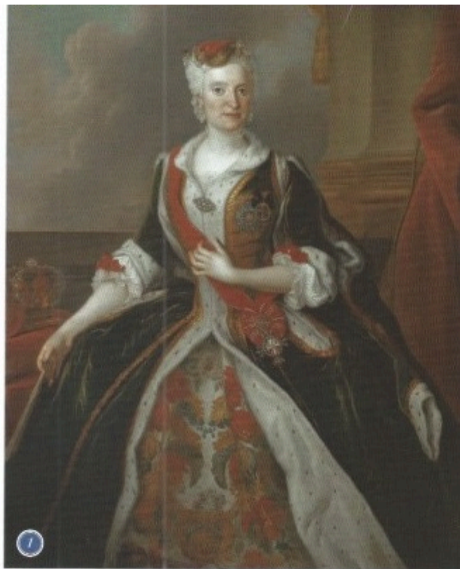
Portret Marii Józefy – Luis de Silvestre, po 1719

As far as the coronation portrait of Augustus III in Polish national attire is well-known, the portrait of Queen Maria Josepha, also by Louis de Silverstre from 1737 in a ceremonial Polish attire is something completely rare. The portrait, located in the Wilanów Museum depicts the wife of King Augustus III in an attire which is more of a costume dress-up than the real thing. Already